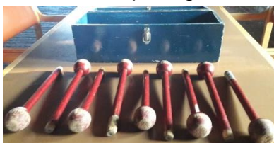
9 vang-stokken en met een blauwe op bergbak

Elke gevangen val stok levert een punt op zijn alle 9 val stokken gevangen door een en de zelfde persoon krijgt deze speler 5 bonuspunten, hierbij is de maximaal te behalen score 14 punt